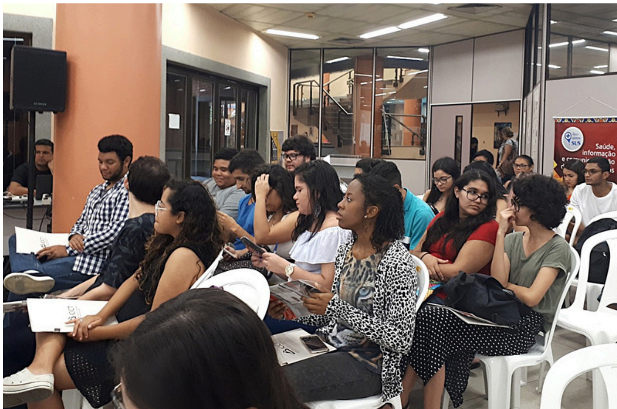
Público assistindo as palestras do I Encontro de Ex-librismo

A partir do I Encontro, se intensificaram