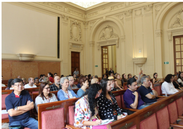
Auditório durante as palestras do II Encontro de Ex-librismo