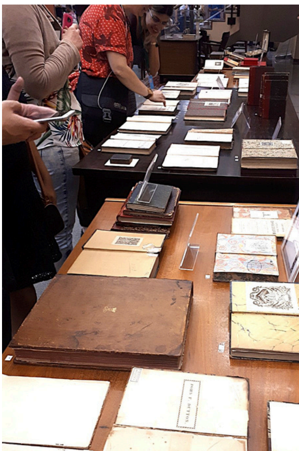
Exposição de livros no I Encontro de Ex-librismo

e se ampliaram as conexões ex-libristas, resultando em um grupo que veio a formar o Gelb.