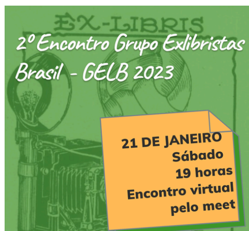
Chamada para o II Encontro do Gelb

espontânea, estendidos a profissionais de distintas áreas, a artistas, gravadores, pesquisadores, colecionadores, historiadores, bibliotecários e representantes de importantes instituições. Em um curto espaço de tempo o grupo cresceu, obtendo êxito em sua abrangência. O ano de 2021 marca dois importantes momentos para o grupo. Em julho uma enquete é realizada para definir o nome do grupo, sendo a sigla vencedora “Gelb”. Enquanto em outubro foi organizado um concurso interno para a elaboração da nossa logomarca. Com vários projetos inscritos, foi escolhido o design proposto por Gerson Witte - um