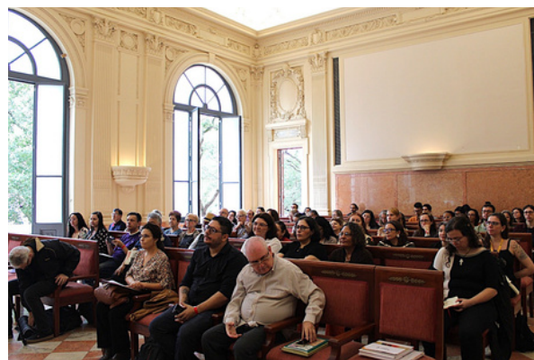
Participantes acompanham as palestras do II Encontro de Ex-librismo

Na sequência, o ex-librista, colecionador